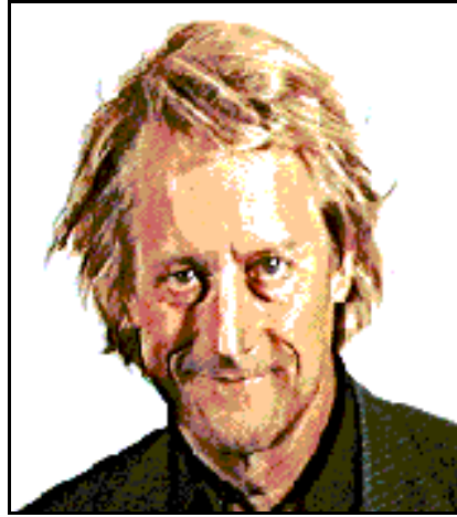
Ted Nelson.

Su obsesivo afán por registrar prácticamente todo, lo ha llevado a coleccionar no cajas, sino bodegas completas repletas de infinidad de objetos, recortes, máquinas, herramientas, libros, discos y casi cualquier soporte en el que pueda registrarse información. Ese mismo afán lo condujo a interesarse por el incipiente mundo de la computación desde su juventud, en la agitada década de los 60. Los entonces rudimentarios lenguajes de programación fueron ya suficientes para que el visionario Ted, junto con una miríada de hackers adolescentes, vislumbrara las potencialidades inhe-